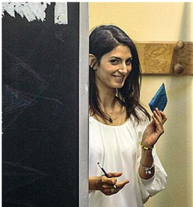
Con la scheda in mano Virginia Raggi subito dopo il voto (Jpeg)